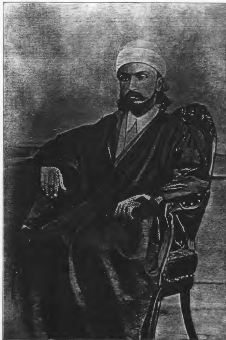
Mirsa Hussein Ali genannt Behá ullah †. (S. 212.)