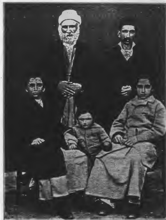
Jugendbilder des Beha ullah und Subh-i Asal, sein Halbbruder. (S. 212.)