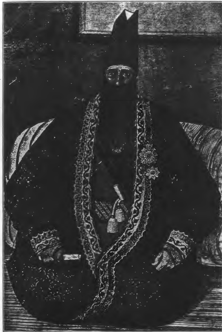
Der Verfolger der Babi 1852 Mirza Agha Khan der Grossvezier. (S. 212.)