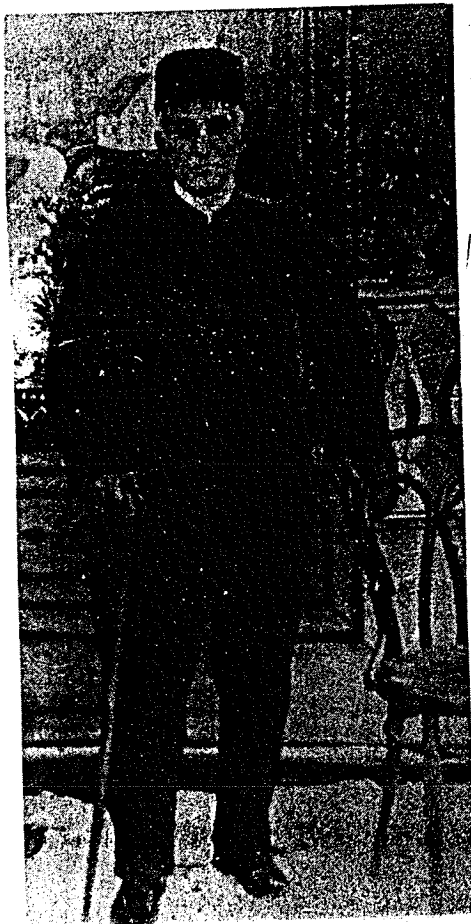
میرزاتقی خان قاجار (بهین آئین)

املاك باقراف راداشت این بزرگوار از خد متگذاران برجسته و مهلغین مطلع و کامل بود و شایستگی داشت تاریخه اش در مصابیح هدایت درج گردد. لکن هرچه جستجو شد سرگذشتش بدست نیامد این مرد بقرار مسموع سلسله نسبش (یاحتمل از جانب مادر) بسلاطین قاجار میرسیده و با آقا میرزا یوسفخان ثابت وجدانی خویشی داشته و هنگامی که آن وجود نازنین با مر بدیع ایمان آورده و در صدد تبلیغ او یعنی میرزا تقیخان برآمده این با او دشمن شده و مجبورش ساخته است تا نامزد عقد کرده خود را طلاق بدهد اما میرزا تقیخان بعد از این وقایع سروسامانش روپربشانی نهاده و اموالش تلف و املاکش از دستش بیرون و خود او در گذر گشته و از قزوین بطهران رفته و بکارهای پست مشغول شده حتی چندی در میدانچه سرقهرا آقا در قهوه جوش حلبی زنجبیل و دارچینی دم میکرده و میفروخته تا اینکه بوسیله غیر معلومی به احباب نزدیک شده و بتحقیق پرداخته و عاقبت با امر اعظم مؤمن گردیده و بعد از اقبال افیون راکه سخت بان معتاد بوده و شبانه روزی چهارده مثقال میکشیده بیکبارگی ترك نموده و در حوزه درس حضرت صدرالصدور داخل شده و از شدت اشتعال در مدت قلبی چهارصد حدیث در بشارت ظهور از بر کرده و سفرهایی بعزم نشر نفحات باطراف نموده و در همه جا و همه حال مؤید و موفق بوده در ساری بیز